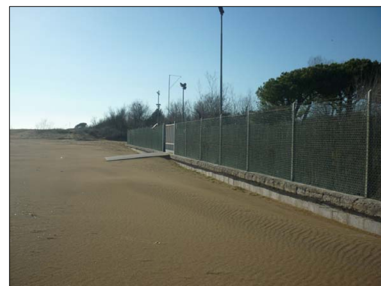
Foto 6 VISTA DI UNO DEGLI ACCESSI ALL'ARENILE