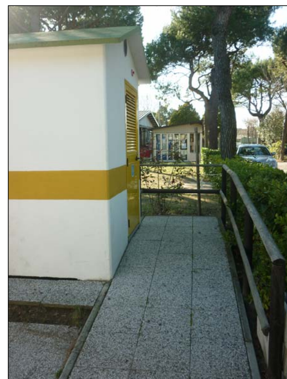
Foto 2 SERVIZIO IGIENICO PER DISABILI ESISTENTE