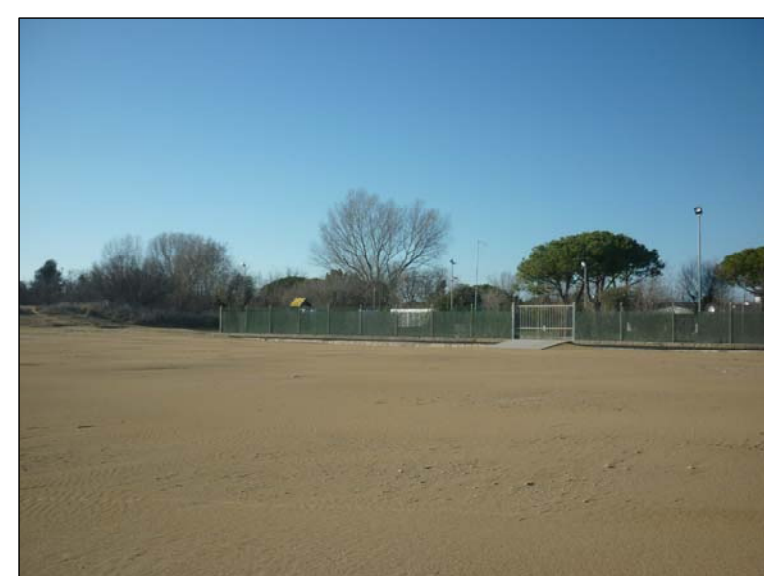
Foto 8 CAMPEGGIO SILVA VISTO DALL'ARENILE