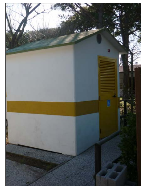
Foto 3 SERVIZIO IGIENICO PER DISABILI ESISTENTE