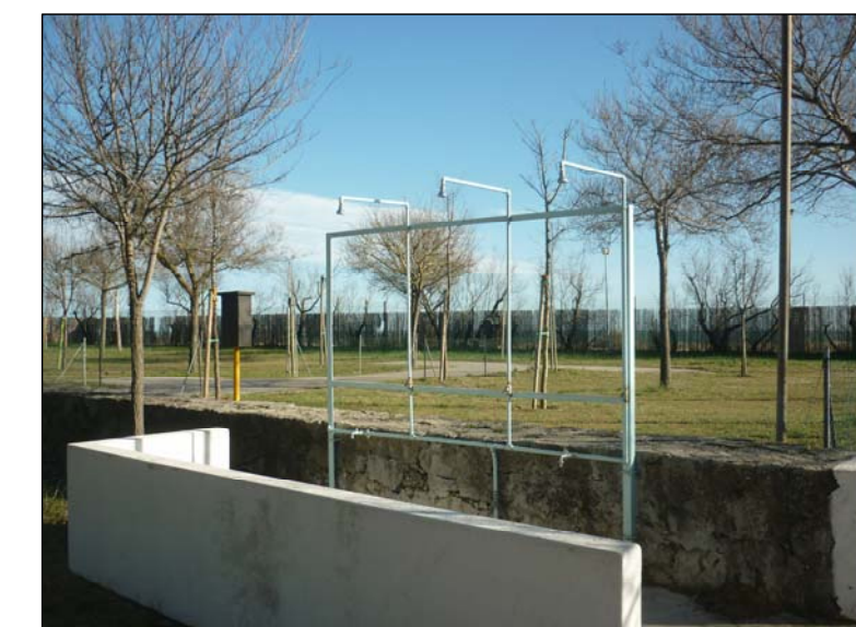
Foto 5 GRUPPO DOCCE ESISTENTE ALL'INTERNO DEL COMPLESSO RICETTIVO A SERVIZIO DELL'ARENILE