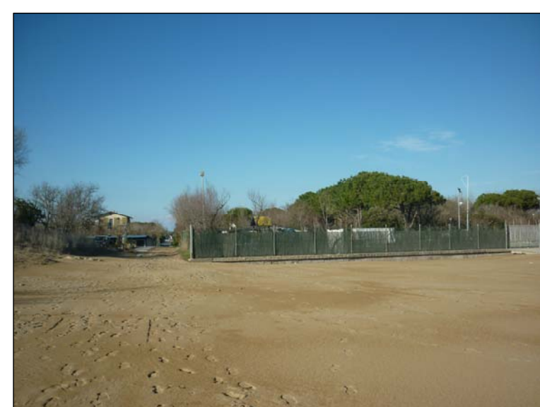
Foto 10 ACCESSO A MARE N. 34 VISTO DALL'ARENILE

PLANIMETRIA GENERALE COMPARTO N. 30 COMPARATIVA