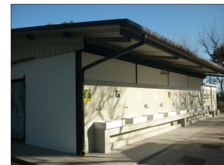
Foto 1 GRUPPO SERVIZI IGIENICI ESISTENTE