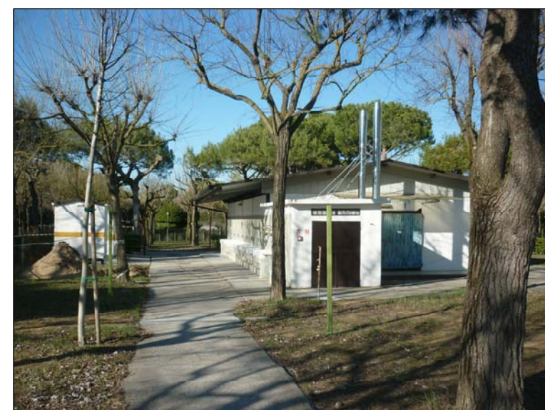
Foto 4 GRUPPO SERVIZI IGIENICI ESISTENTE RIPRESO DAL PERCORSO DI ACCESSO ALL'ARENILE