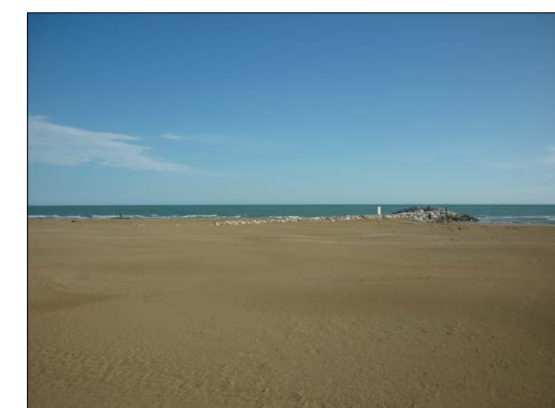
Foto 7 PENNELLO N. 3 DEL CONSORZIO BOCCA DI LIDO