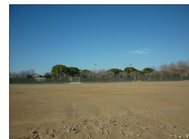
Foto 9 CAMPEGGIO SILVA VISTO DALL'ARENILE