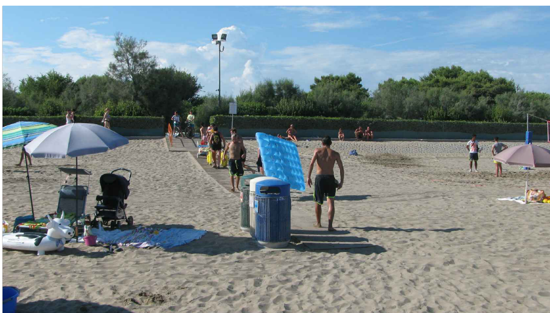
Foto 08 - Vista fronte accesso 4