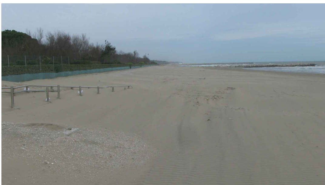
Foto 02 - Vista dal limite ovest del comparto