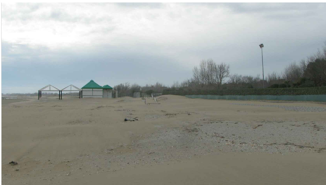
Foto 03 - Vista verso il chiosco