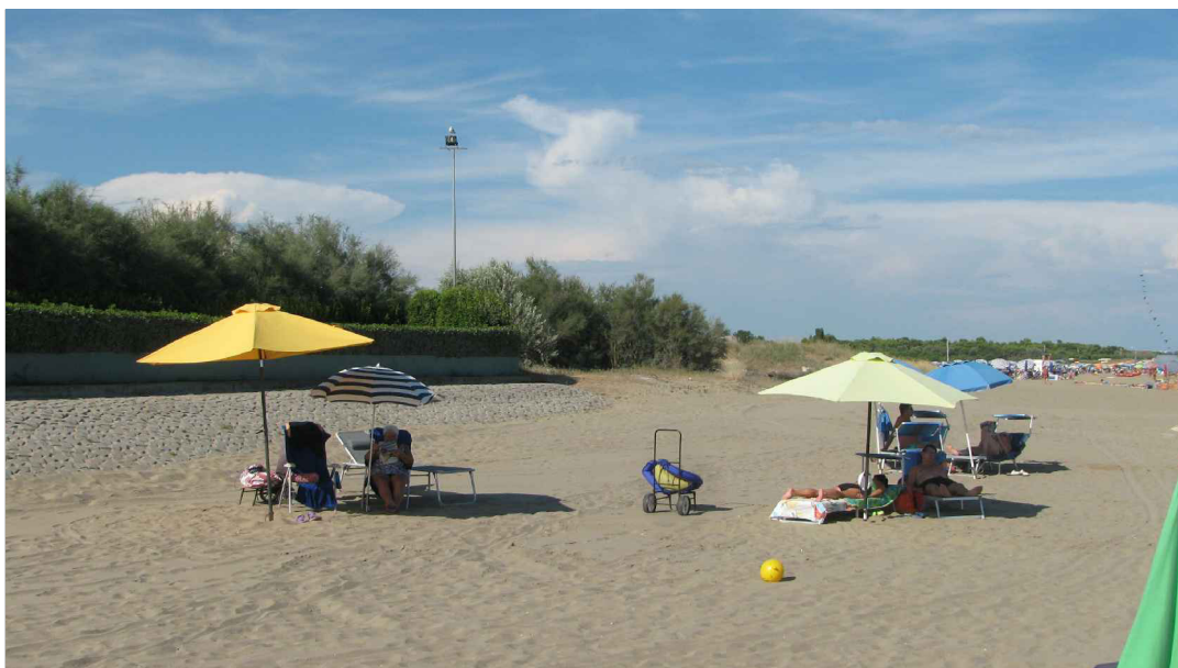
Foto 09 - Vista limite campeggio