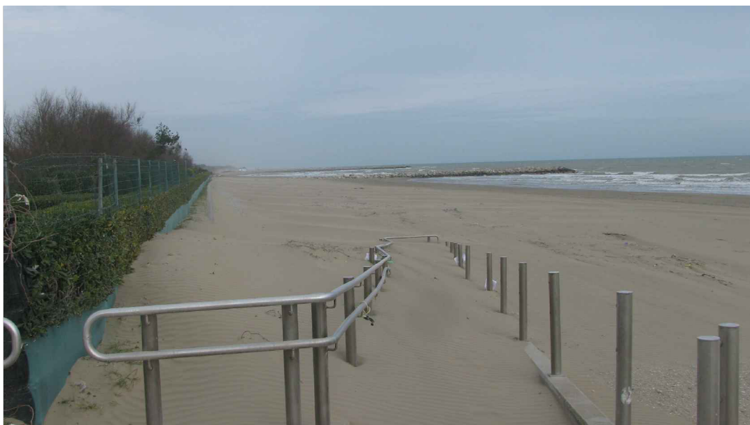
Foto 01 - Vista dall'Accesso al Mare 13