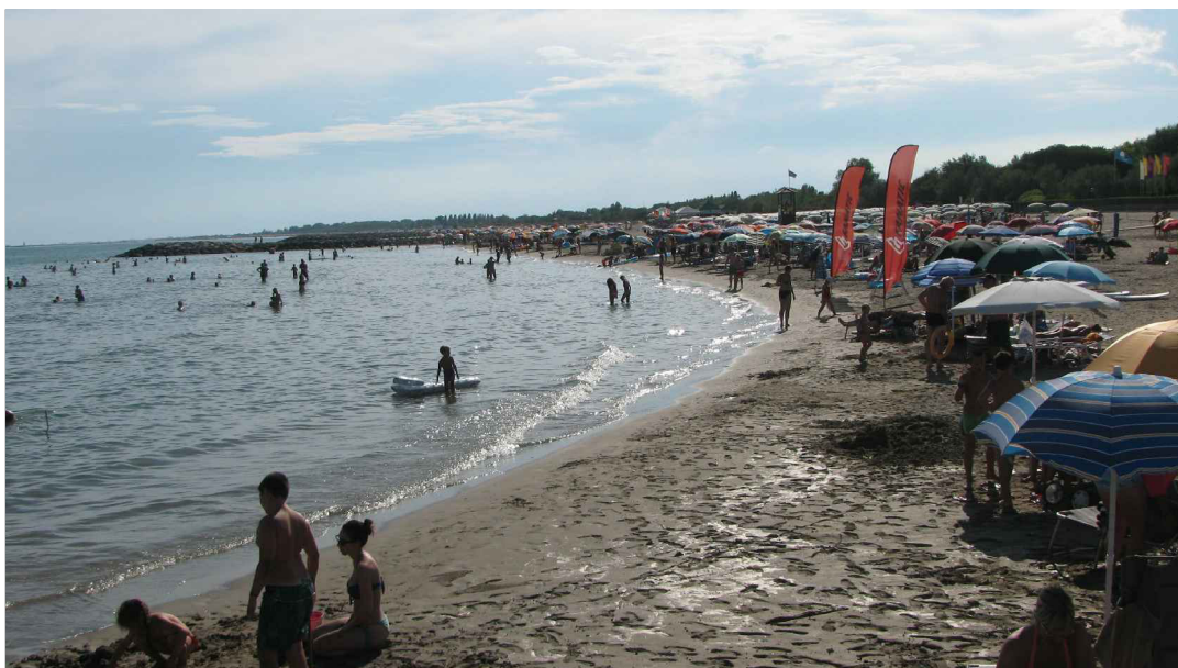
Foto 11 - Vista battigia