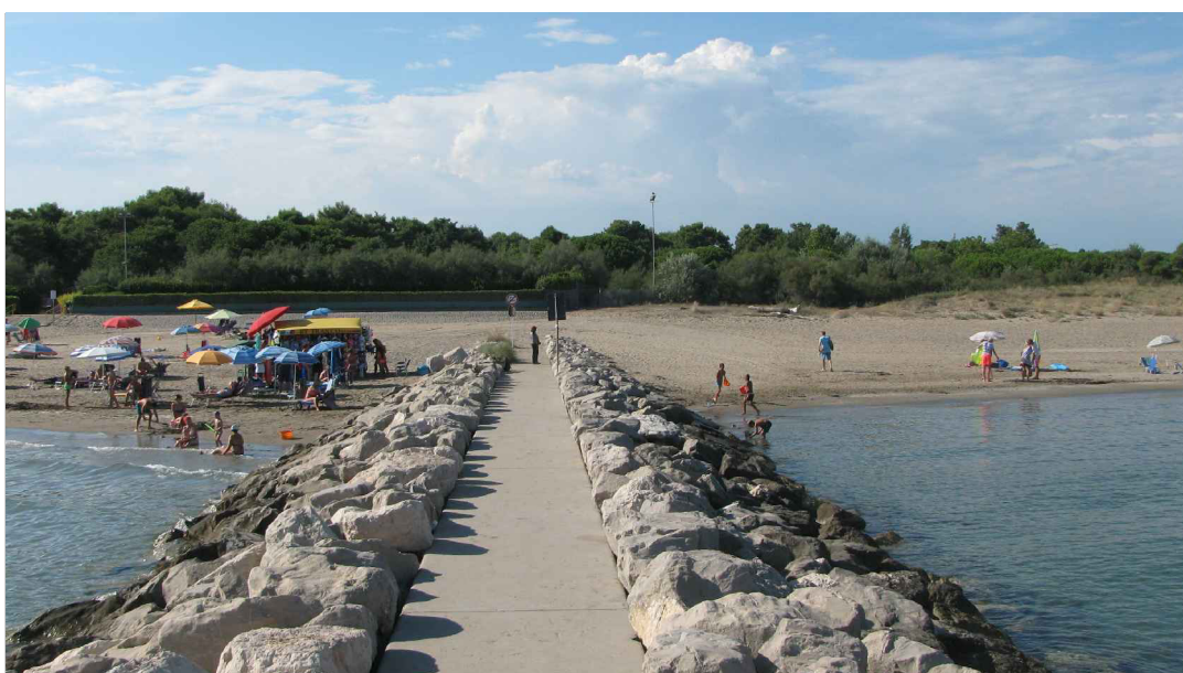
Foto 12 - Vista da pennello a mare