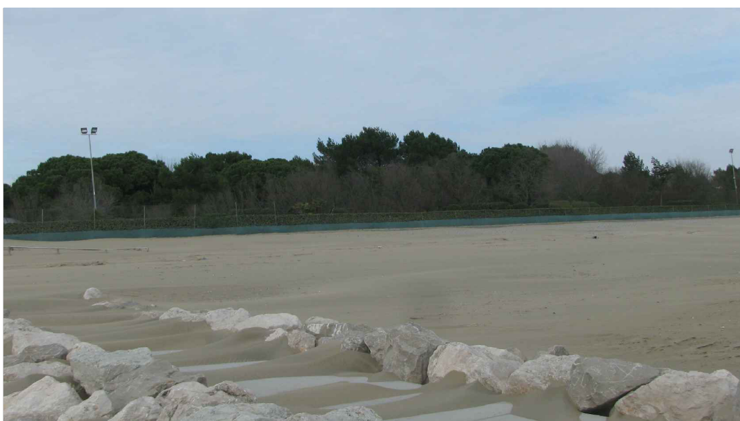
Foto 04 - Vista dal Pennello 28