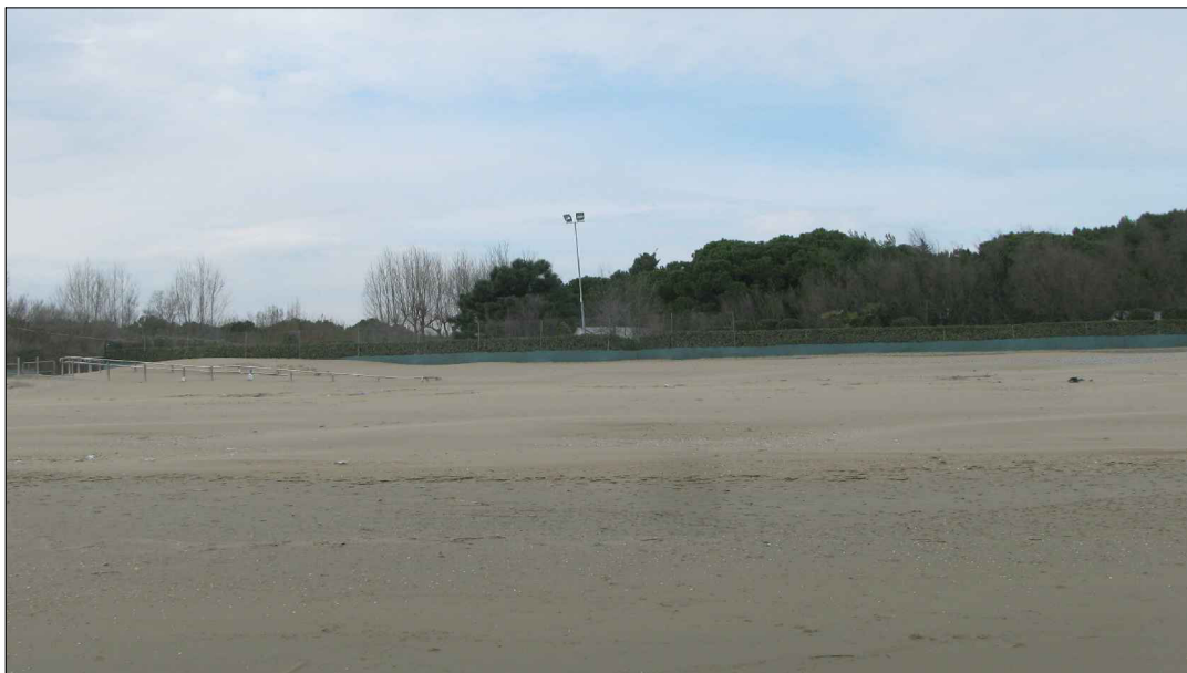
Foto 05 - Vista porzione ovest fronte del campeggio