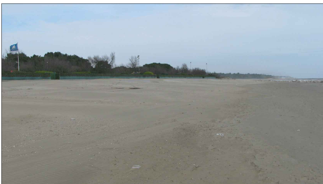
Foto 06 - Vista fronte est del campeggio